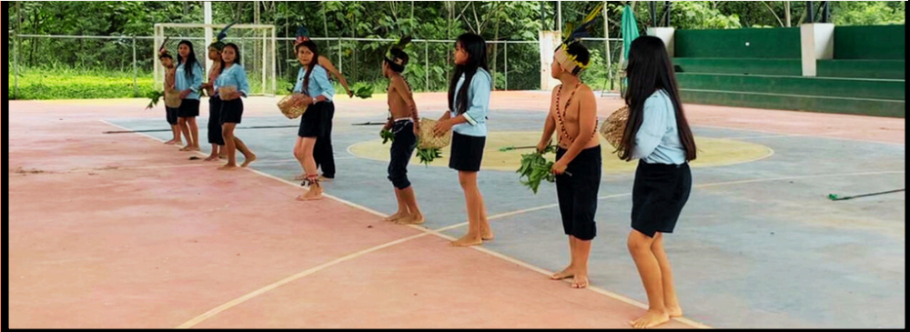
En esta fotografía observamos a los estudiantes de 8vo. y 9no. de Educación Básica del Colegio Oriente Ecuatoriano danzando YAYA JUMANDI .

En esta otra imagen se puede ver la danza presentada por el grupo de jóvenes de la Cdad. Club el Agricultor .