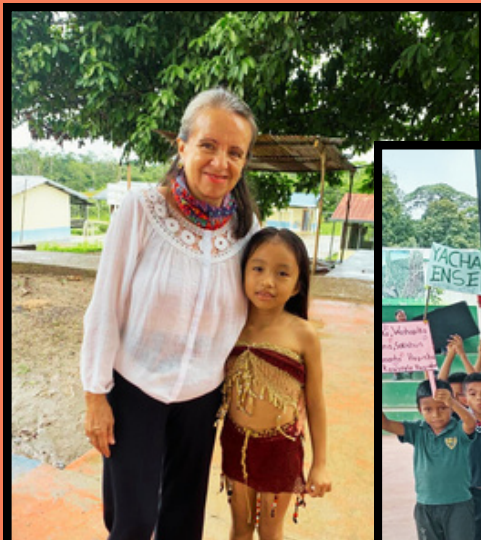
Los niños/as del 4to. y 5to. de básica cantaron la Canción SHUK UMATA CHARINI .